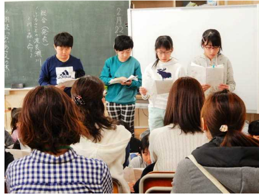
5年1組 総合的な学習