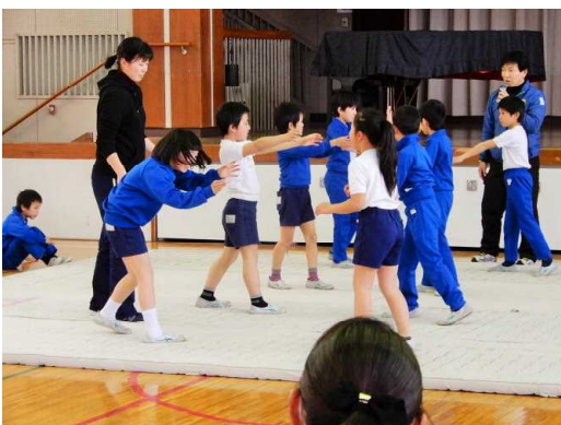
3年(合同) 学習発表会