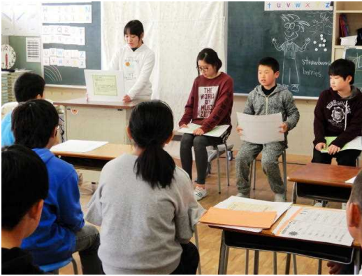
6年1組 総合的な学習

一年間の子供の成長というのは、すばらしいかと、学校で児童に関わっているといつも思います。1年生の初めての授業参観は5月ですが、その時にはまだひらがなも十分に書けなかった児童が、これまで学んで身に付けた跳び箱や楽器、音読などを立派に発表する姿を見ると、感動してしまいます。我が子なら、なおさらでしょうね。6年生は、英語を交えながら、自分の将来の夢を語りました。もうすぐ小学校を卒業して中学校へ進みます。夢に一步近づけるよう頑張してほしいです。